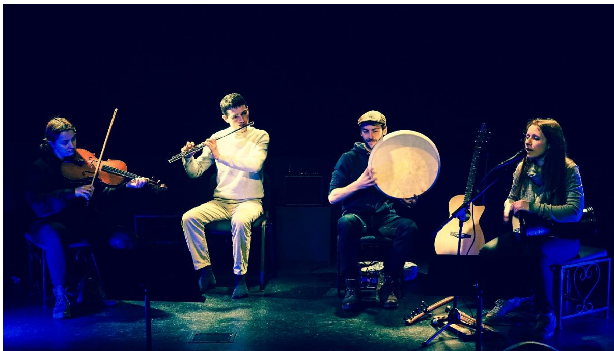
Poyraz, L'Arrosoir, Février 2020

Au total, ce sont environ 100 artistes qui ont été accueillis, accompagnés ou soutenus par l'Arrosoir, là aussi amateurs, professionnels ou en voie de le devenir.