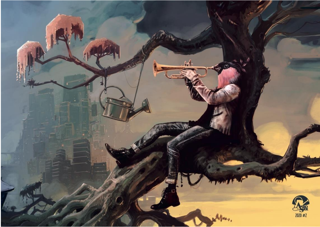
Visuel 2 ème trimestre 2020