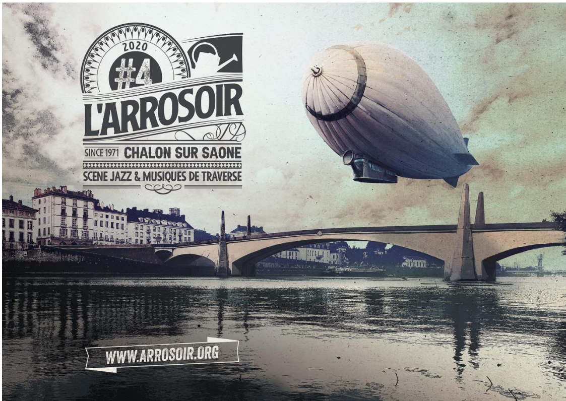
Visuel 4 ème trimestre 2020